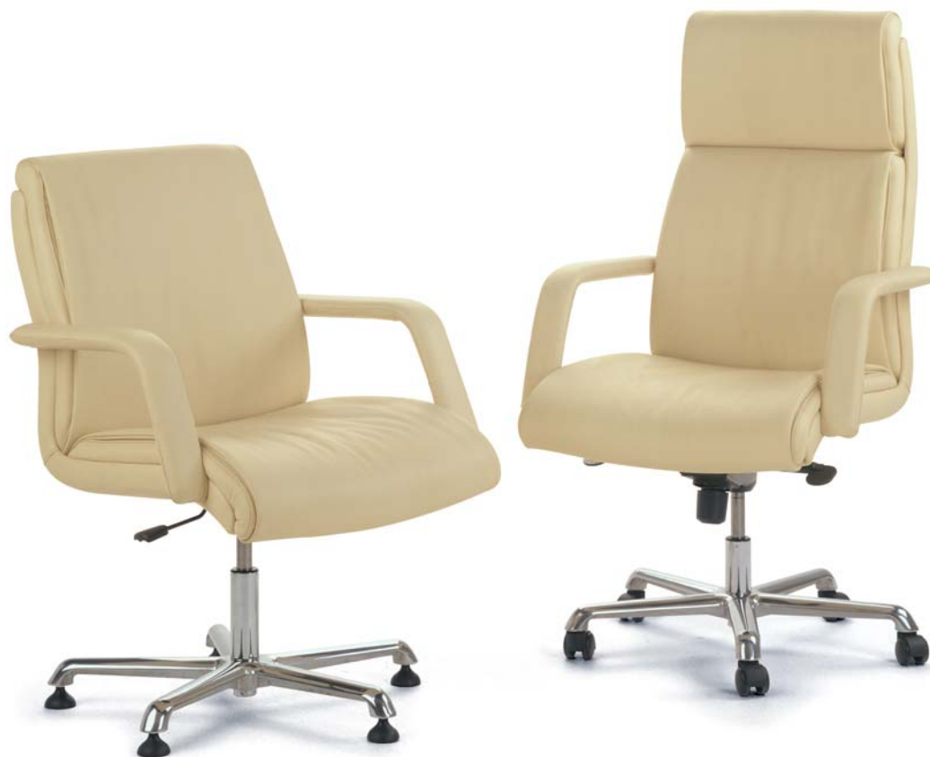
BOSS RG RESPALDO BAJO GIRATORIA