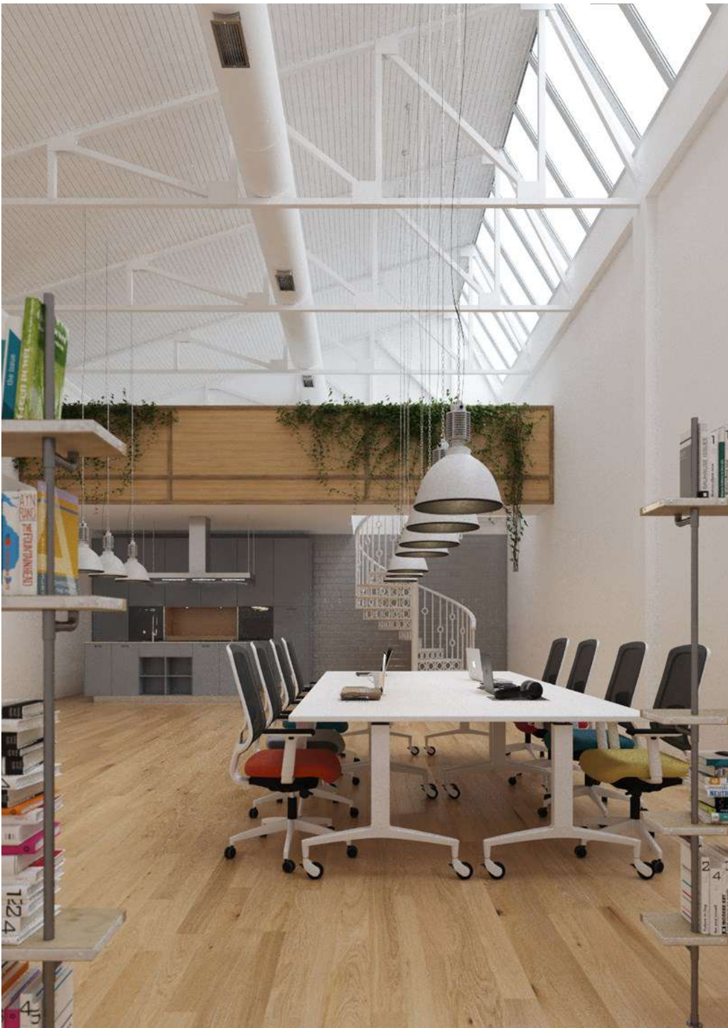
Tkno y Scala