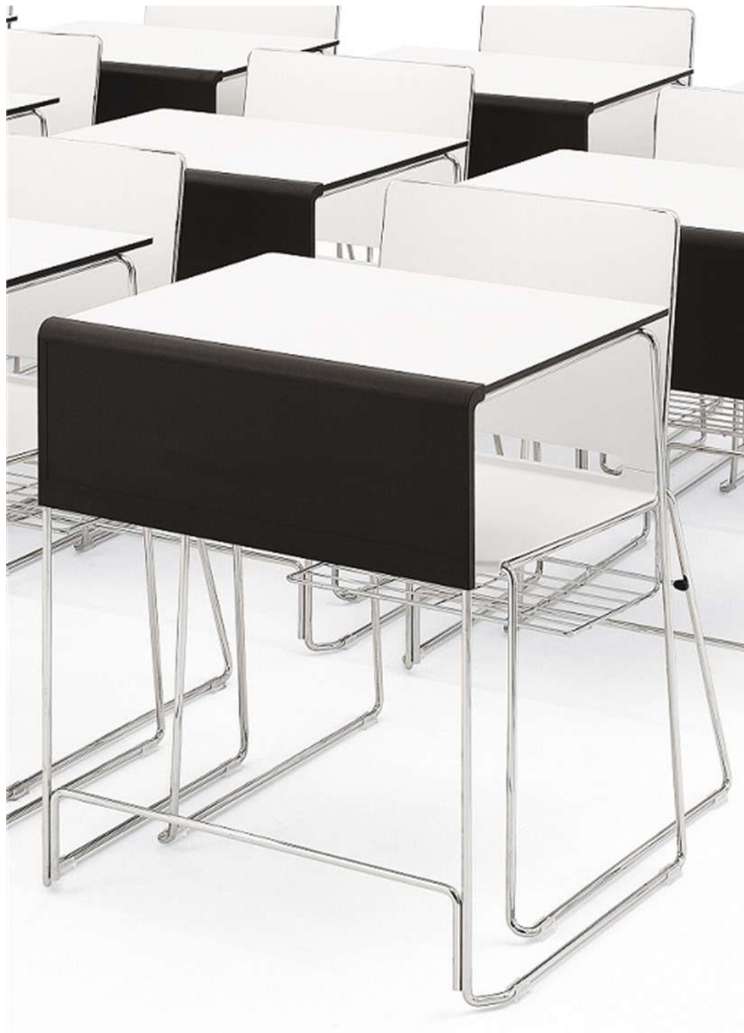
Clever y Urban