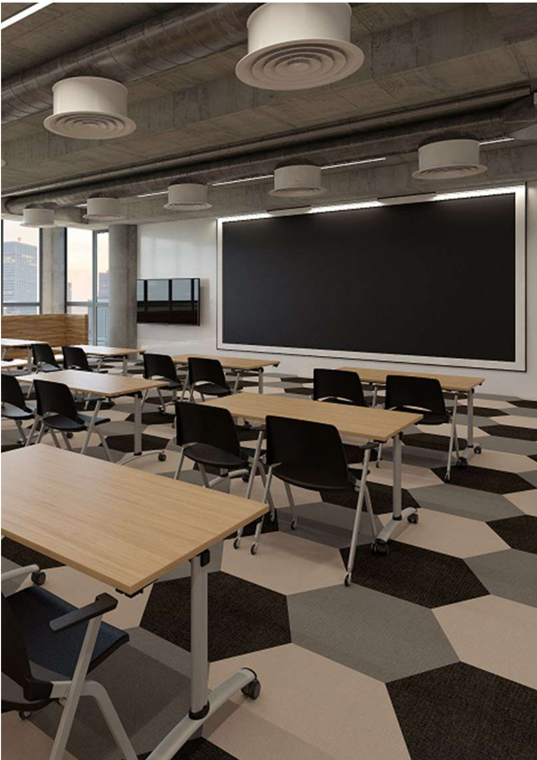
Lobby y Atlas