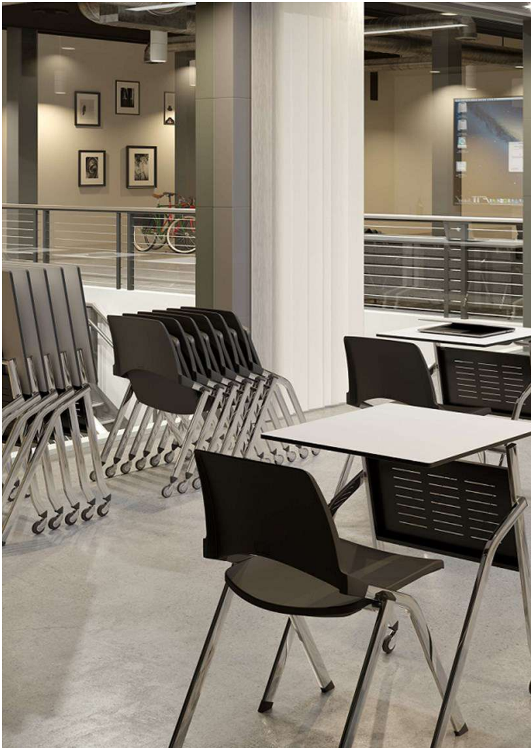
Row y Atlas