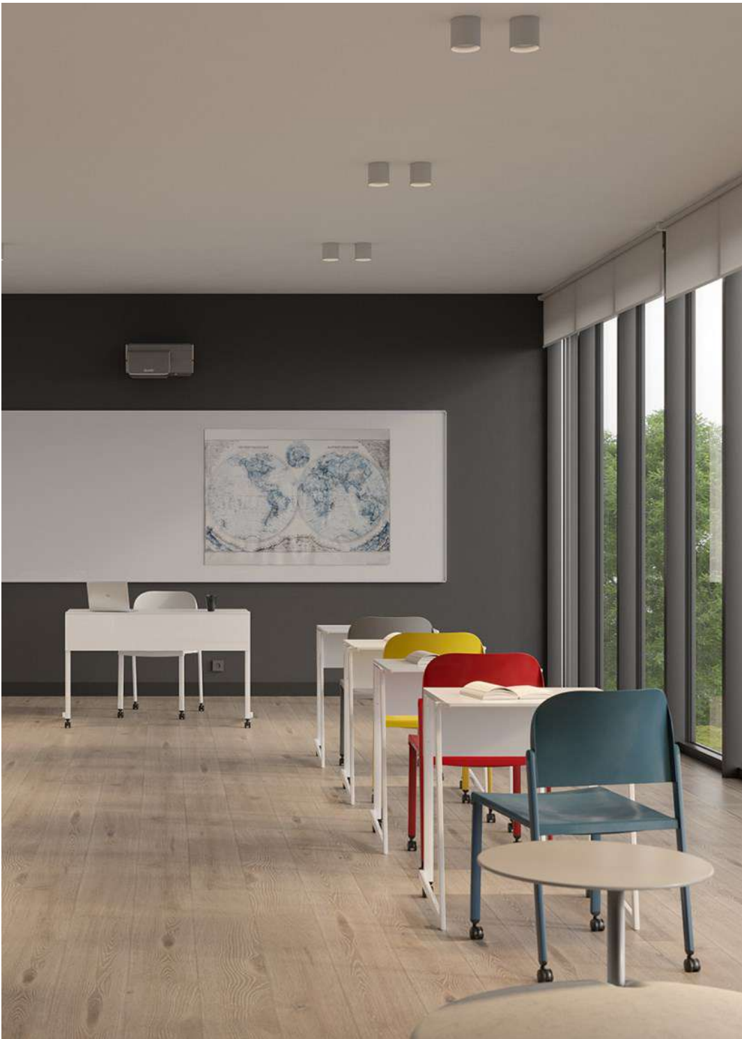
Wake Up y Pile Up