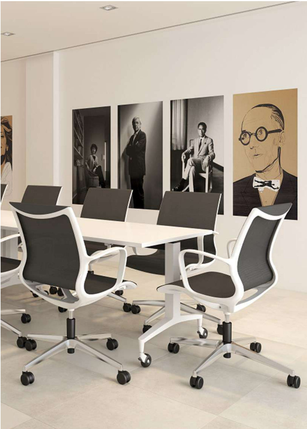
Hydra y Tkno