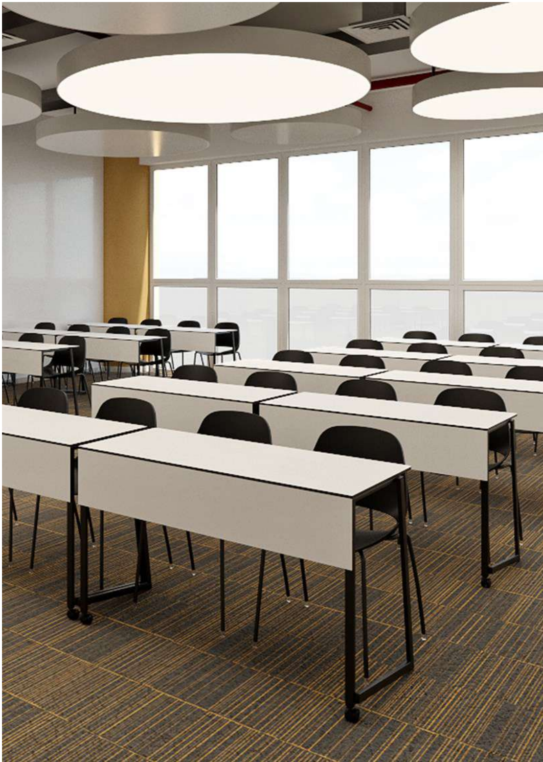
Pile Up y Elipse