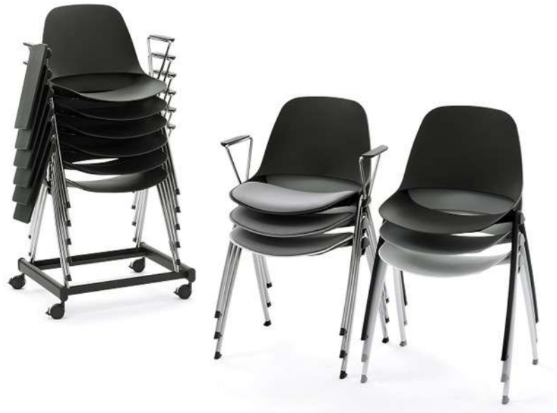
Elipse Design: Angelo Pinaffo